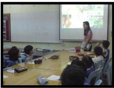
图十： 引起学生的注意力

根据观察，学生的眼神、面部表情、反应、言行举止等告诉我他们喜欢直观教学。另外，两位实习伙伴所填写的勾选表清楚显示学生对教师的直观教学感兴趣，积极回答教师所发问的问题，也积极参与教师所设计的活动。此外，两份实习伙伴的观察报告也很清楚提到直观教学确实能激发学生学习的兴趣。