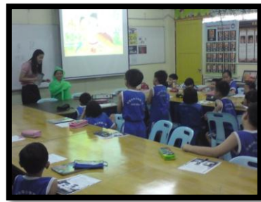
图十一： 学生充满好奇心